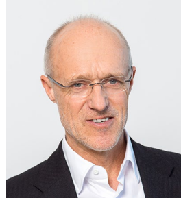
Mag. Toni Innauer Ehemaliger Sportler, Trainer und Sportdirektor beim österreichischen Skiverband