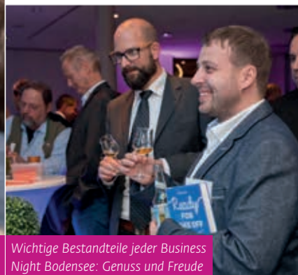
Wichtige Bestandteile jeder Business Night Bodensee: Genuss und Freude