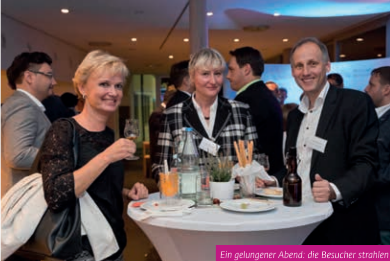
Ein gelungener Abend: die Besucher strahlen