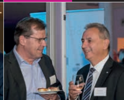
Das Netzwerk ausbauen und festigen: Zwei Unternehmer nutzen die Chance