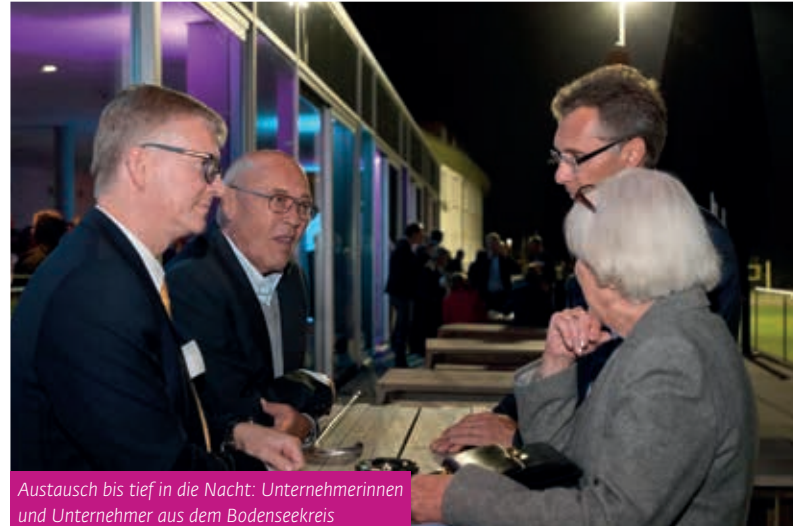
Austausch bis tief in die Nacht: Unternehmerinnen und Unternehmer aus dem Bodenseekreis