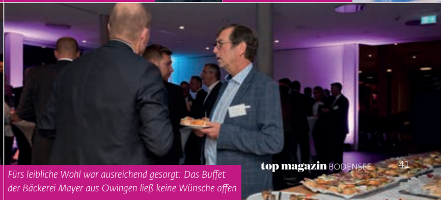
Fürs leibliche Wohl war ausreichend gesorgt: Das Buffet der Bäckerei Mayer aus Owingen ließ keine Wünsche offen