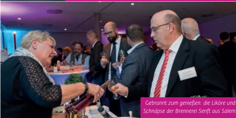
Gebrannt zum genießen: die Liköre und Schnäpse der Brennerei Senft aus Salem