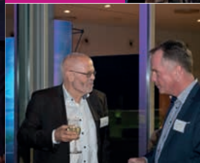
Gespräch zwischen Unternehmern: einander kennen bringt Vorteile