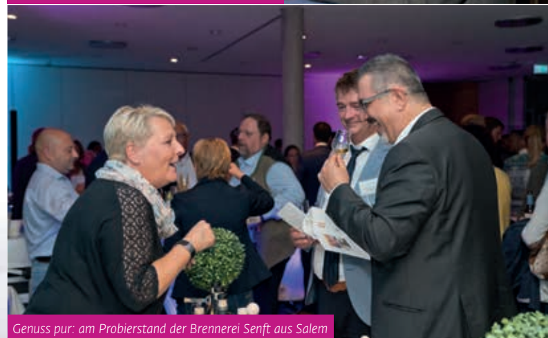
Genuss pur: am Probiertand der Brennerei Senft aus Salem