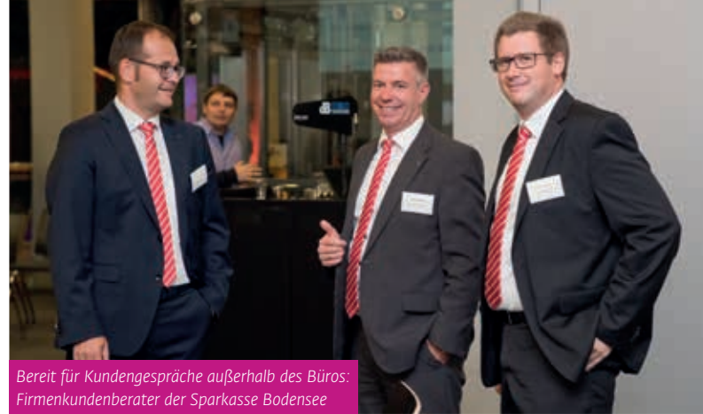
Bereit für Kundengespräche außerhalb des Büros: Firmenkundenberater der Sparkasse Bodensee