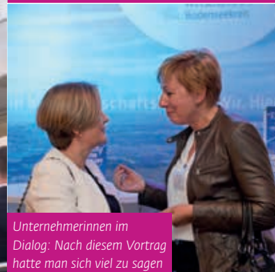
Unternehmerinnen im Dialog: Nach diesem Vortrag hatte man sich viel zu sagen